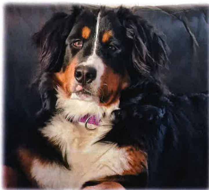
Et nydelig bilde av Øverbyåsens Alles Lykke, her 7 mnd.