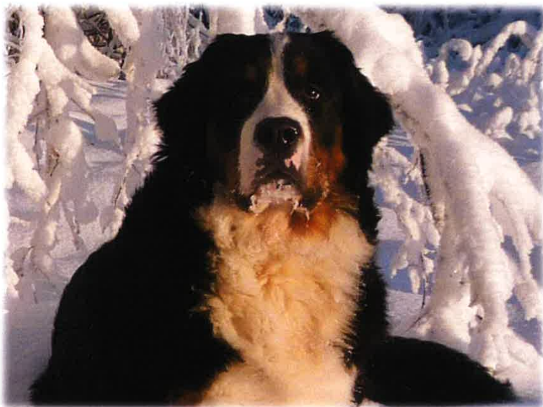
Nellyvill's I'm The One