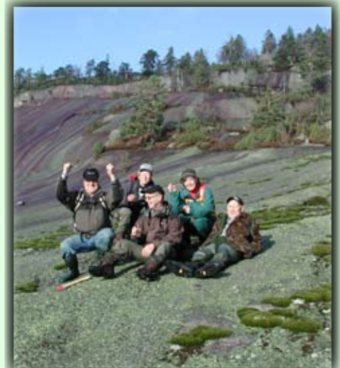
Glade turfolk ved de flotte Svobergfjella