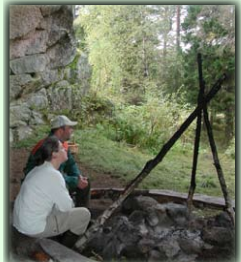
God stemming i Råmundshelleren

Anfangspunkt: Man muss die Hauptstrasse 406 ungefähr 17km gegen Evje fahren bis man Kylland mit einigen Bauernhöfen auf der rechten Seite passiert.