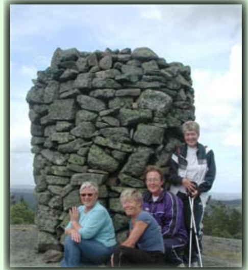
Ved den flotte varden på toppen

Ca 17 km fra Birkeland. Det er parkeringsplass langs veien ved Kylland